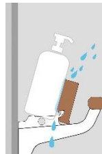
ボトル類を斜めに傾けて収納し、水を切ることができます。

2つのスタイルで使える棚板は外して洗えるのでお手入れ簡単。水切りスタイルならボトルの下に水が溜まらずヌメリやカビの防止になります。