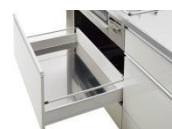
ステンレス引出し底板