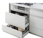
コンロキャビネット