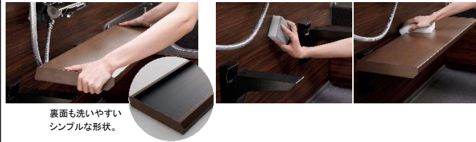
裏面も洗いやすい シンプルな形状。

簡単に取り外して丸洗いできるから、カウンターの裏面までキレイ。周囲の壁やフロアのお手入れもラクにできます。普段のお手入れはスポンジが入る隙間があるので取り外すことなく行えます。