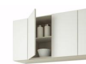
ミドル吊戸棚(高さ70cm)