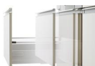
サイレントレール