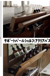
サポートバー&シェルフ(アクリアバス)