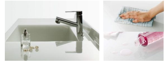
※アクリストンクオーツカウンターはTIARIS専用です。

硬いからキズが付きにくく、長期使用でも汚れが溜まりにくい素材です。更に表面が滑らかなため、拭くだけでキレイ。耐薬品性にも優れ、家庭用の洗剤や薬品では変質・変色の心配がほとんどありません。