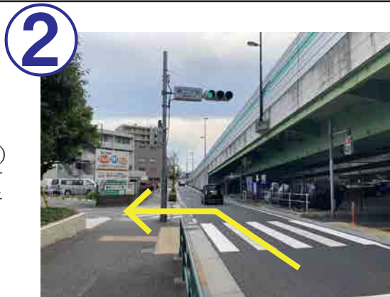
2 錦二丁目交差点の信号を、左折してください。