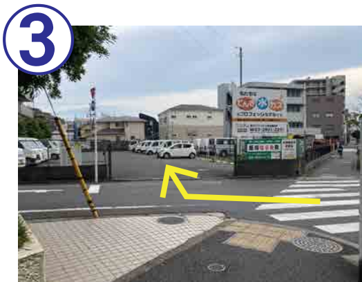
3 すぐ右手にある駐車場に入ってください。