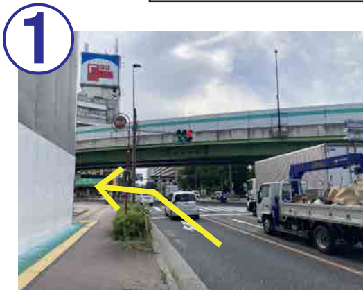
1 川越街道（下り）から、練馬北町交差点を、左折して下さい。

東京ガスライフバル板橋練馬東ショールーム ◇住所 〒179-0082 東京都練馬区錦 2-18-15 1F ◇TEL : 03-3931-3201 FAX : 03-3559-2958 ◇営業時間 : AM10:00 ~ PM17:00 ◇休館日 : 木曜日・日曜日・祝日