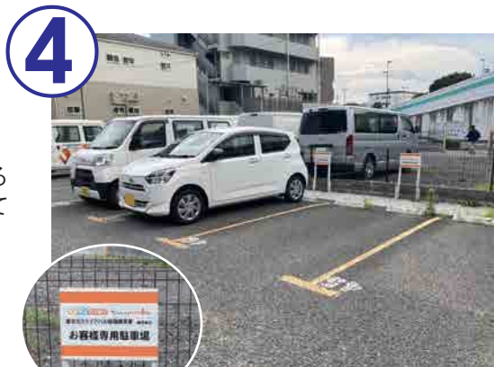
4 右手側に駐車場がございます。