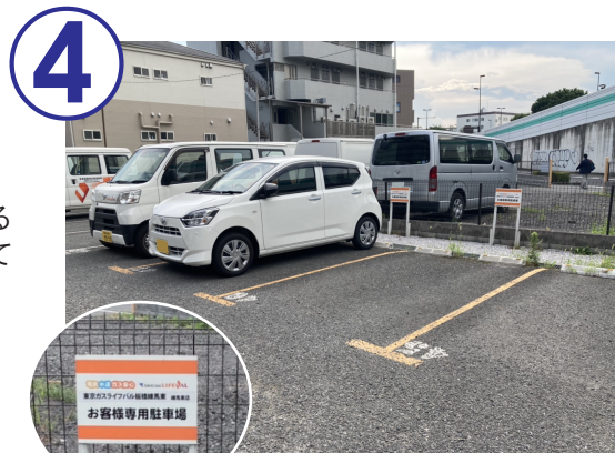
4 右手側に駐車場がございます。