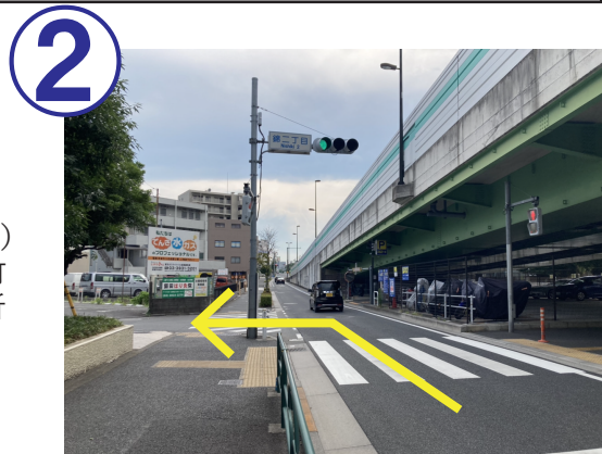
2 錦二丁目交差点の信号を、左折してください。