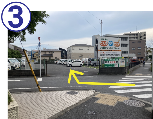
3 すぐ右手にある駐車場に入ってください。