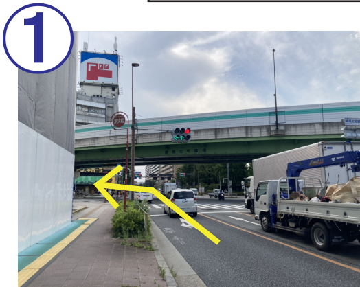
1 川越街道（下り）から、練馬北町交差点を、左折して下さい。

東京ガスライフバル板橋練馬東ショールーム ◇住所 〒179-0082 東京都練馬区錦 2-18-15 1F ◇TEL：03-3931-3201 FAX：03-3559-2958 ◇営業時間：AM10：00～PM17：00 ◇休館日：日曜日・祝日